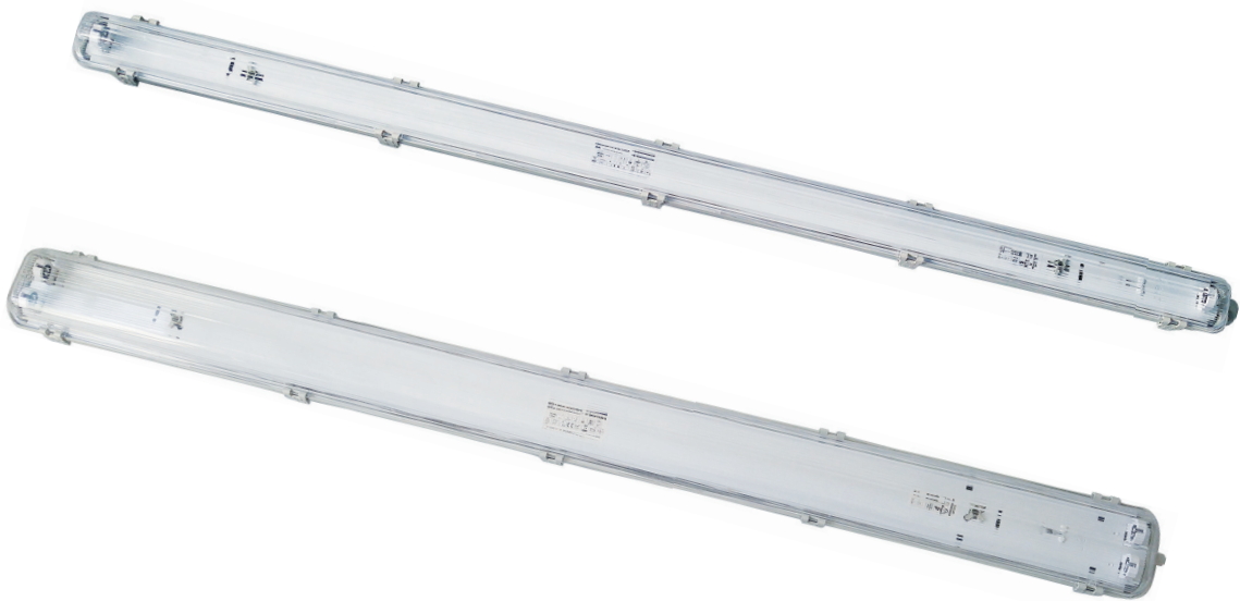
TRUST LED PS 1xT8*