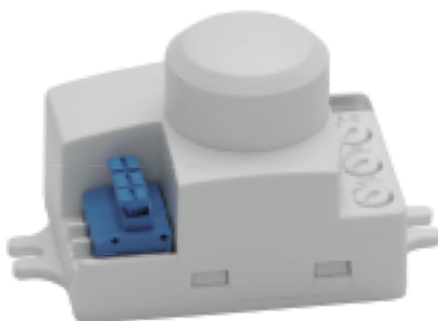
ROLF MINI JQ-L