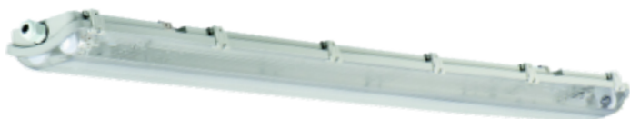
● DICHT N-218/4LED/PS

prachotěsné svítidlo / prachotesné svetidlo